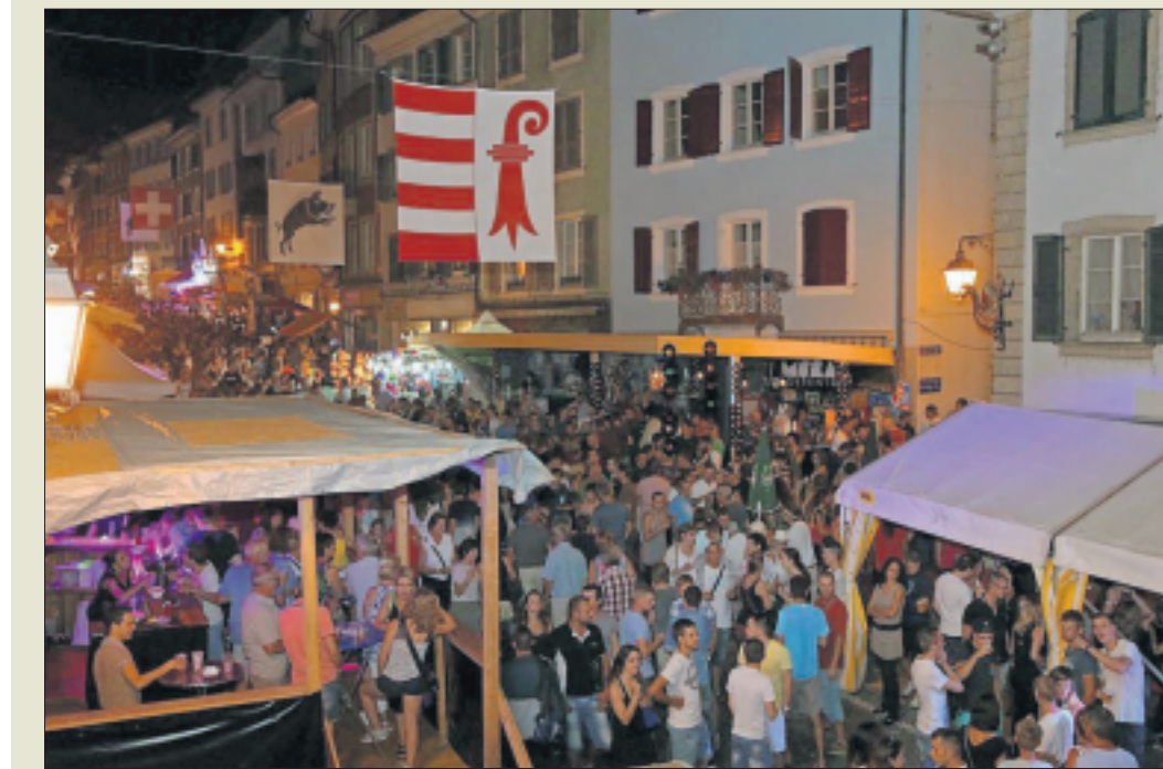
Quelque 65 000 visiteurs ont pris part aux 80 ans de la Braderie de Porrentruy ce week-end.

Vendredi, les rues ont connu une affluence digne d'un samedi. On n'a jamais vu non plus se parquer autant de véhicules en ville pour un feu d'artifice. De la patinoire à Saint-Charles, en passant par les zones résidentielles du Banné ou de la Colombière, tout était plein samedi soir. Des 400 places assises proposées rue de la Chaumont pour