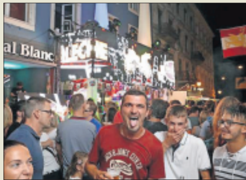
Bonne humeur de mise toute la nuit, samedi.