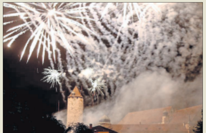
Point d'orgue de samedi, le feu d'artifice de 22 minutes tiré depuis le château.