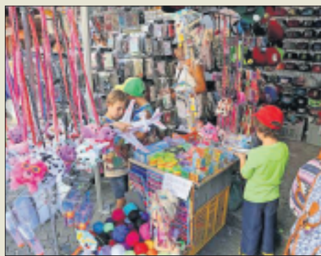
La Braderie, c'est aussi la chasse aux bonnes affaires.