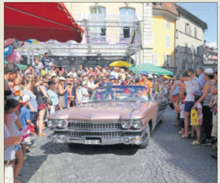
Dimanche, des rues noires de monde au passage du cortège de vieilles voitures.

voir le feu, il n'en restait plus une. La rue Trouillat, elle, était noire de monde levant les yeux au ciel pour admirer un spectacle piromusical de 22 minutes qui en a surpris plus d'un. Dimanche enfin, c'est de nouveau la foule des grands jours qui s'est massée le long des rues pour admirer un cortège de Braderie qui n'avait pas eu lieu depuis plus de 20 ans. Dix véhicules, emmenés par la Fanfare de Bubendorf quand la Société de cavalerie d'Ajoie fermait la marche avec 15 chevaux, le composaient. Miss