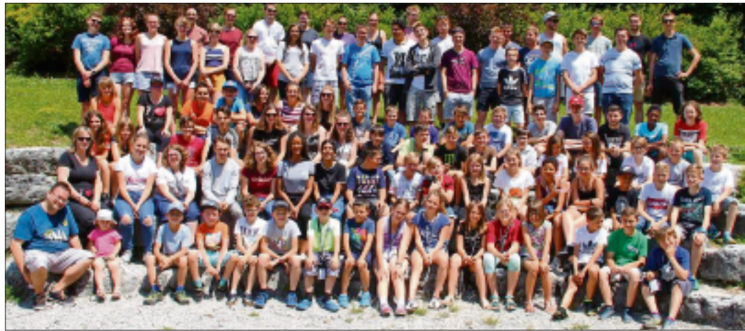
Grand succès pour le camp de musique de la FJM qui a battu son record de participation avec 83 passionné(e)s.

Nouveau record de participation au camp annuel des jeunes de la Fédération Jurassienne de Musique (FJM), qui se déroule cette semaine à Charmey. Alors qu'ils étaient 81 l'année passée, ce sont 83 jeunes musiciennes et musiciens du canton du Jura, du Jura bernois et de Bienne qui se retrouvent cette année afin de peaufiner leurs connaissances musicales.